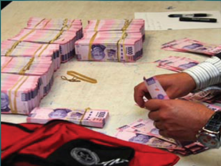
¿Quién se habrá quedado con las ganas de este pastel?