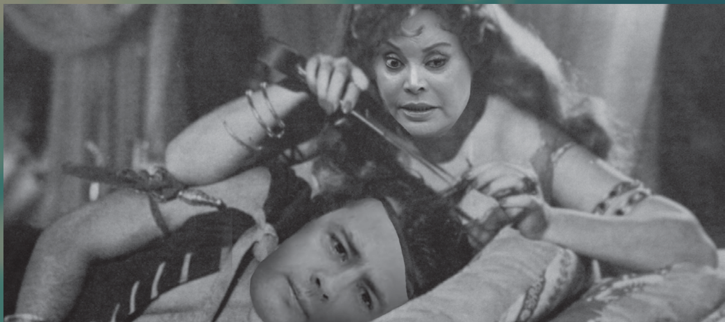
Fotograma de la película: Lo Que Le Pasó a Sansón.

Dice la maestra Elba Esther Gordillo que en política se vale mantener una sana distancia mas nunca un distanciamiento con los interlocutores políticos. Eso parece la ruptura de la alianza entre el Panal y el PRI. En los hechos y en las boletas para los candidatos a diputados y senadores de la república no irán juntos. Pero no sabemos hasta dónde mantiene la alianza electoral con Enrique Peña Nieto.