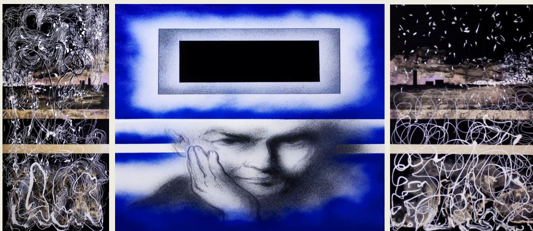
Pintura de Ángel Orcajo