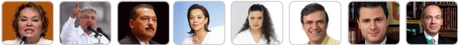
Imagen Pública y Satisfacción con la situación general del país 2007 - 2010